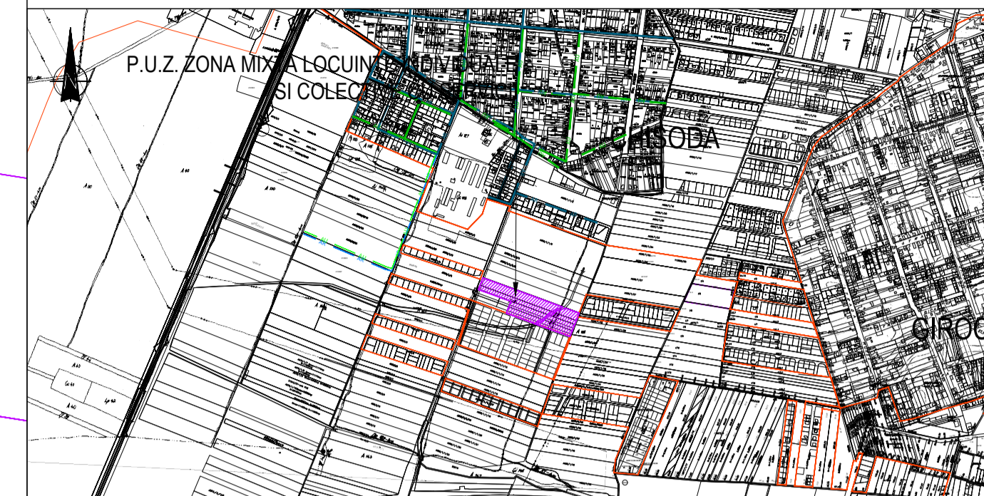
PLAN DE INCADRARE IN LOCALITATE